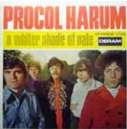
Cover der von unserem Gewinner erstandenen französischen Auflage von A Whiter Shade of Pale : „Die rätselhaften Texte von Keith Reid bieten sich für die Rästelecke an!“