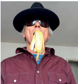
Gegen Rassismus im Fußball