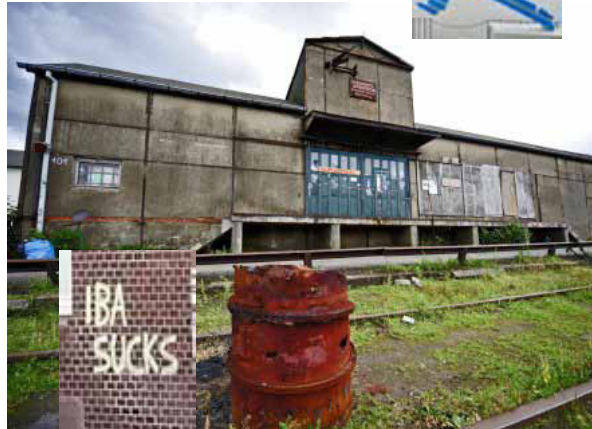
Ehemalige Industriehalle in Wilhelmsburg: Drehort des Erfolgsfilms, zuletzt Tanzhalle

Wilhelmsburg ist im Gespräch. Aber bereits vor IBA und igs spielt ein international prämierter Film in diesem zentralen Stadtteil: Er handelt von einem Restaurant, das sich gegen die Auswirkungen der Gentrifizierung stemmt. Der Altonaer Regisseur des Films ist auch dafür bekannt, dass er gemeinsam mit Helmut Schmidt seine Liebe zu Hamburg bekundete.