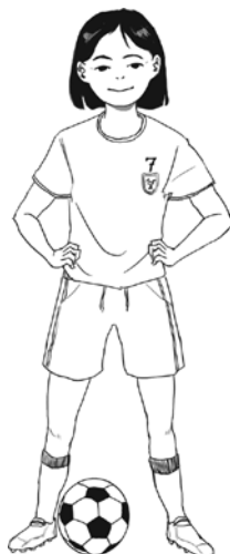
Suri am Ball.