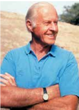
Thor Heyerdahl (1914-2002): norwegischer Forschungsreisender, Archäologe, Anthropologe, Ethnologe und Umweltaktivist