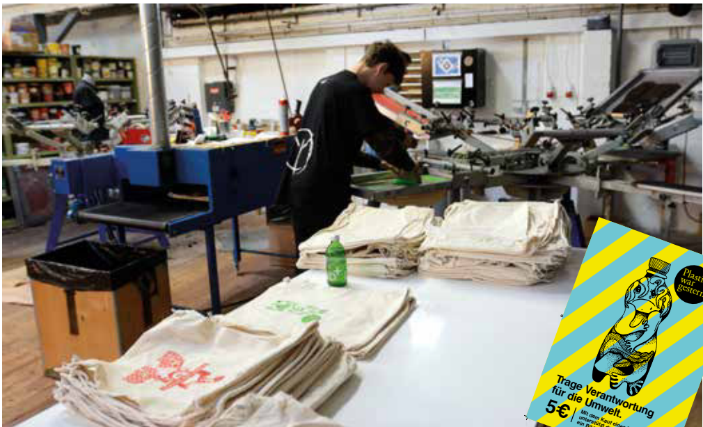
Bedrucken der Rucksäcke im Siebdruckverfahren

in diesem Netzwerk gemeinsam mit anderen Hamburger Schulen zusammen.