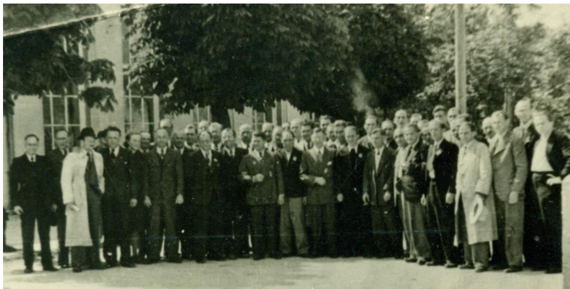
Gründungsversammlung Timmendorfer Strand

Vor 70 Jahren, am 6. Juni 1948, wurde die Arbeitsgemeinschaft Neuengamme gegründet.