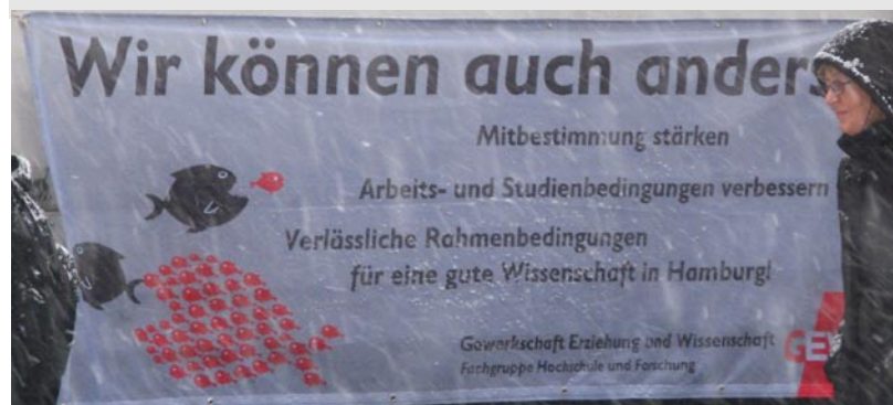
Transparent der Fachgruppe auf der Demonstration „Bildung und Kultur für alle“ am 16. Dezember 2010

Service, Kontakt und Informationen: siehe Rückseite