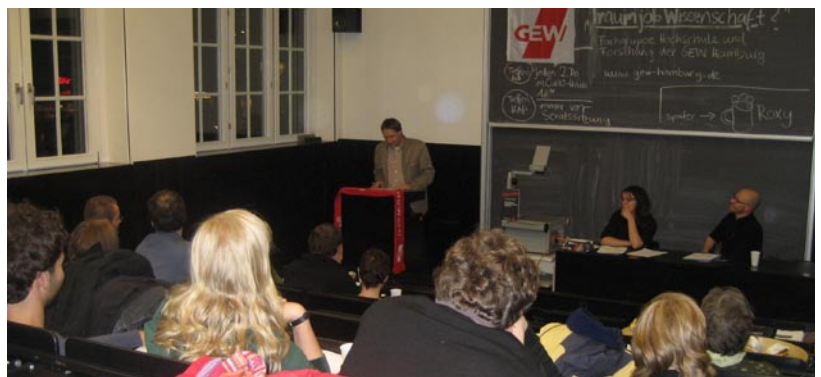
Veranstaltung der GEW „Traumjob Wissenschaft?“ am 17. November 2010 im Hauptgebäude der Uni Hamburg

Da die Wissenschaft auf Bestenauslese ausgerichtet ist und dieses System ‚Verlierer‘ benötigt, kann sich diese Phase – trotz hoher Qualifikation – für den Einzelnen als Abstellgleis erweisen: Als Privatdozent oder im Rahmen drittmittelfinanzierter Projektstellen in Warteposition erhoffen sich die DoktorInnen oft als nächste Station eine gesicherte Stelle. Gerade aufgrund der Altersstrukturen – die BewerberInnen auf eine Professur sind wegen der langen Qualifizierungsphasen im Durchschnitt 42 Jahre alt – ist auch die Familienplanung schwierig. Dies gilt als ein Grund, weshalb Frauen gerade in der Habilitationsphase stärker benachteiligt sind. Der Geschlechteraspekt zeigt weitere Problemlagen in der akademischen Personalstruktur auf. Zum einen gelten Frauen als benachteiligt, da sie zahlenmäßig den Männern stark unterliegen. Zum anderen jedoch entstehen aktuell durch politisch forciertes Gender Mainstreaming für den männlichen Wissenschaftsnachwuchs spezifische Schwierigkeiten. Während sich für Frauen die Qualifizierungsschwellen Promotion und Habilitation als stärkere Ausschlussmechanismen erweisen – unter den Habilitanden sind nur noch 24 Prozent Frauen – sind die Männer, da