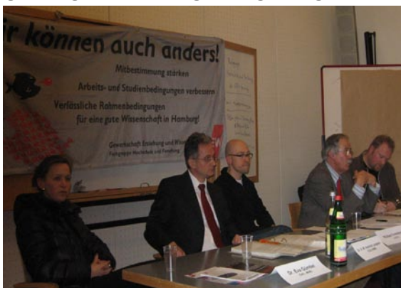
Veranstaltung der GEW mit VertreterInnen der Parteien am 2. Februar 2011 im Curio-Haus

Was ist von der neuen SPD-Alleinregierung und der neuen Senatorin für Wissenschaft und Forschung, Dorothee Stapelfeld, zu erwarten? Im Regierungsprogramm der SPD sind zu den Fragen der Studienfinanzierung, der Hochschulorganisation und der Beschäftigungsbedingungen klare Aussagen zu finden, die sich mit den Forderungen der GEW, der Studierenden und der Beschäftigten in Hochschulen und Forschungseinrichtungen decken. So heißt es u.a.: