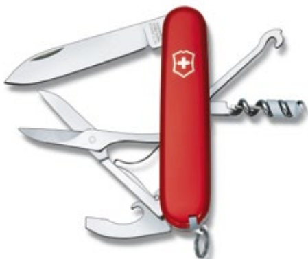
Schweizer Taschenmesser Offiziersmesser mit 15 Funktionen, in rot