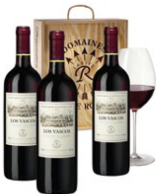
Weinset Los Vacos mit drei Flaschen Cabernet Sauvignon