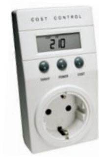
Energiemessgerät kalkuliert und überwacht Energiekosten