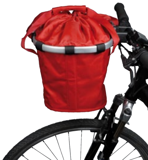
Bikebasket Fahrradkorb von Reisetel