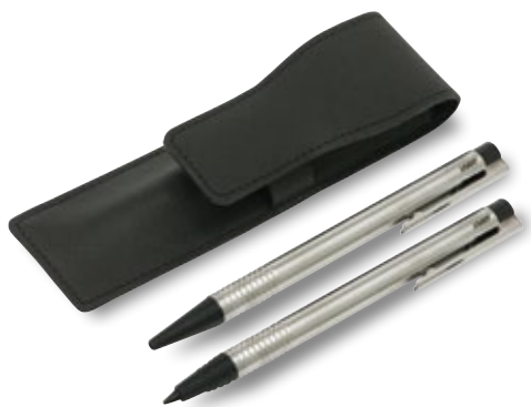
Lamy Logo Set Lamy-Set mit Kuli und Druckbleistift im Lederetui