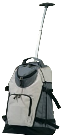
Rucksack-Trolley in grau