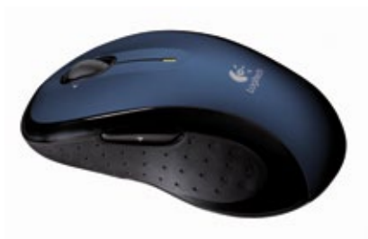
Maus Logitech die schnurlose optische Maus